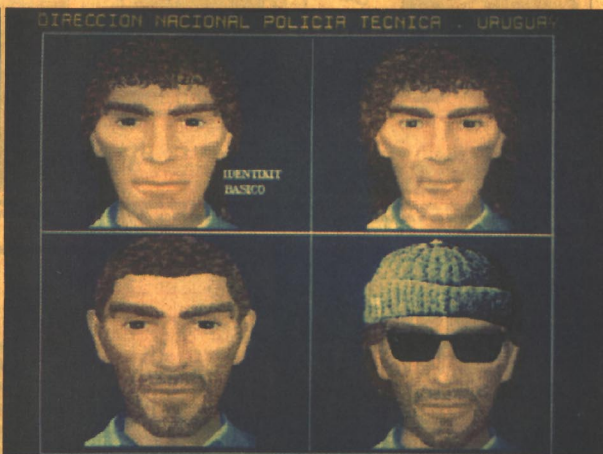
La conformación gráfica, que circula desde la medianoche entre los policías a cargo del operativo de seguridad de la Copa América, muestra cuatro características posibles del homicida buscado

del homicida. Luego se realiza una "máscara de búsqueda" en los archivos, para establecer los porcentajes de caracteres somáticos similares. Todo esto es lo que en nota anterior adelantó EL PAIS y se le denominó "telepolicías".